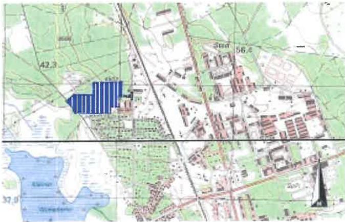
ÜBERSICHTSKARTE M 1 : 20.000