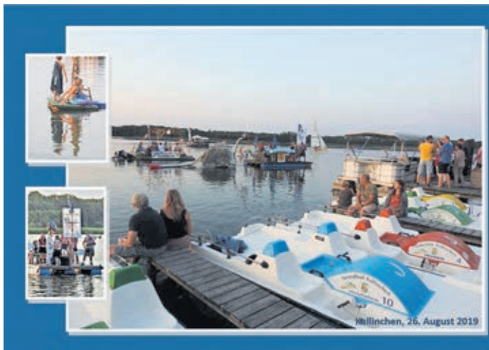
Kallinchen, 26. August 2019

Mehr Fotos unter www.zossen.de/Foto-Impressionen .