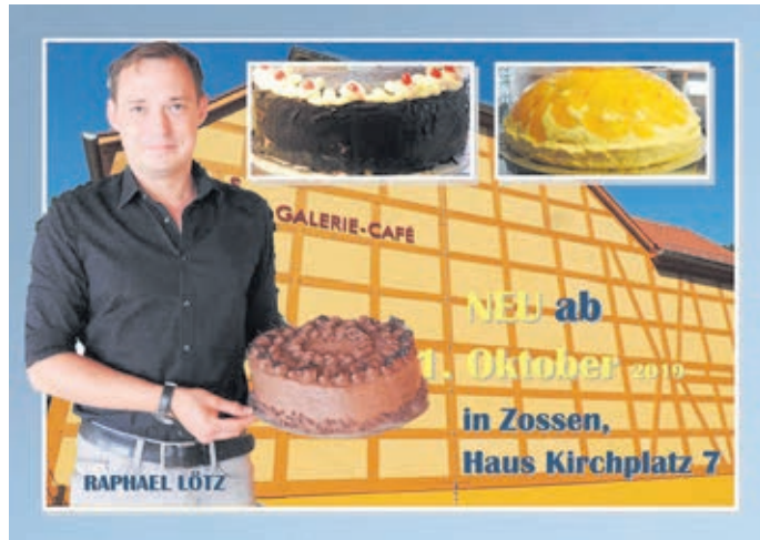
Das Galerie-Café erwartet ab 1. Oktober 2019 seine Gäste von Dienstag bis Sonnabend, 9 bis 18 Uhr.