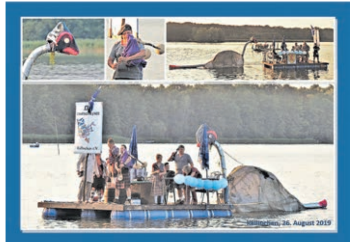
Kallinchen, 26. August 2019

Mehr Fotos unter www.zossen.de/Foto-Impressionen .