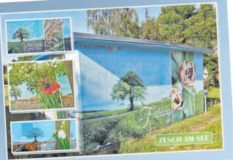
ZESCH AM SEE