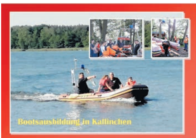
Bootsausbildung in Kallinchen