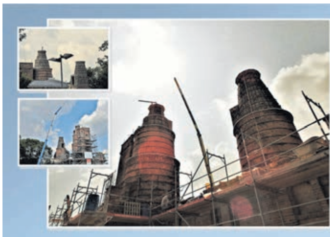
Mehr Fotos von den Kalkschachtöfen auf www.zossen.de/Meldungen .

Zossen. Planmäßig gehen die umfangreichen Sicherungsarbeiten an den Zossener Kalkschachtöfen weiter, die bereits zum Tag des offenen Denkmals am 8. September 2019 in einigen Bereichen für eine Besichtigung begehbar sein sollen. Weitere Gerüste sind inzwischen abgebaut worden, so dass sich die beiden Türme in ihrer ursprünglichen Ansicht präsentieren. Am Tag des offenen Denkmals wird auch ein Mitarbeiter des zuständigen Planungsbüros vor Ort sein, der interessierten Besuchern an diesem Tag Rede und Antwort zum Umfang der erforderlichen Notsicherungsmaßnahmen stehen wird. Zuletzt erfolgten Dachdecker- und Metallbauerarbeiten, nachdem die Arbeiten am Mauerwerk des Treppenturms sowie am Aufzugsschacht beendet worden waren. Über ein künftiges Nutzungskonzept für das imposante Industriedenkmal wird zu einem späteren Zeitpunkt zu entscheiden sein.