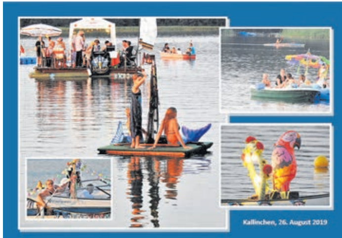
Kallinchen, 26. August 2019

Kallinchen. Für diese Gefilde ungewohnte Klänge waren am 26. Juli 2019 am Ufer des Motzener Sees zu vernehmen. Ein Schottenboot - gestaltet von Campnern des benachbarten Campingplatzes in Kallinchen - schipperte mit einem Dudelsackspieler an Bord auf dem Gewässer. Im Schlepptau hatte die Crew ein an das Ungeheuer von Loch Ness erinnerndes Monster mit langem Hals und feurigen Augen. Ein Name für das Tier war schnell gefunden: statt Nessie wurde es einfach „Motzi“ genannt. Es war nicht das einzige originelle Boot, das sich anlässlich des diesjährigen Kallinchener Sommerkarnevals während des schon traditionellen, inzwischen 19. Boots Korsos präsentierte. Ein kleiner Herrscher der Meere ließ es sich als Neptun mit Nixen und Meerjungfrauen im Gefolge nicht nehmen, als Kinderfloß um die Gunst der Jury zu werben. Auf einem von Hippies geenterten Boot ließ man die Flower-Power-Zeit aufleben und auch ein schwimmender Untersatz mit der Aufschrift „Hurra Ferien“ war von den zahlreichen Sommerfestbesuchern vom Land aus zu bestaunen. Nicht zu vergessen die liebevoll geschmückten Kleinboote, ob als Kajak oder Schlauchboot. Sie alle boten