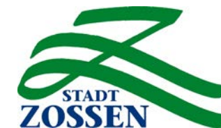
Ergebnis - Ortsteilbildung Dabendorf - Sollen Dabendorf Und Zossen Eigene Ortsteile Werden?