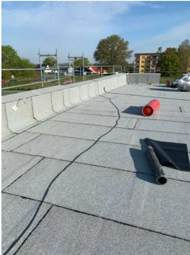
Stadt Zossen, die Bürgermeisterin