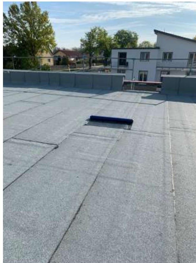
Bericht aus der Verwaltung BBW 10.05.2023