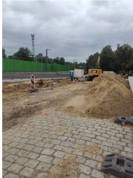
Bericht aus der Verwaltung BBW 18.10.2023