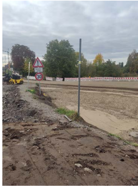
Bericht aus der Verwaltung BBW 18.10.2023