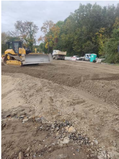
Stadt Zossen, die Bürgermeisterin