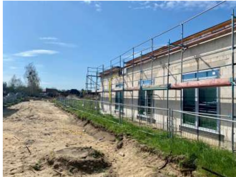
Bericht aus der Verwaltung