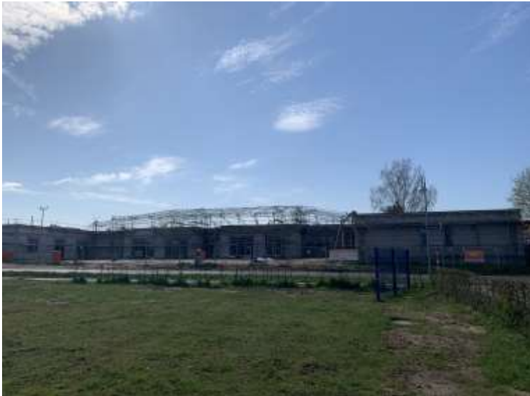
Stadt Zossen, die Bürgermeisterin, BBW 19.04.2023