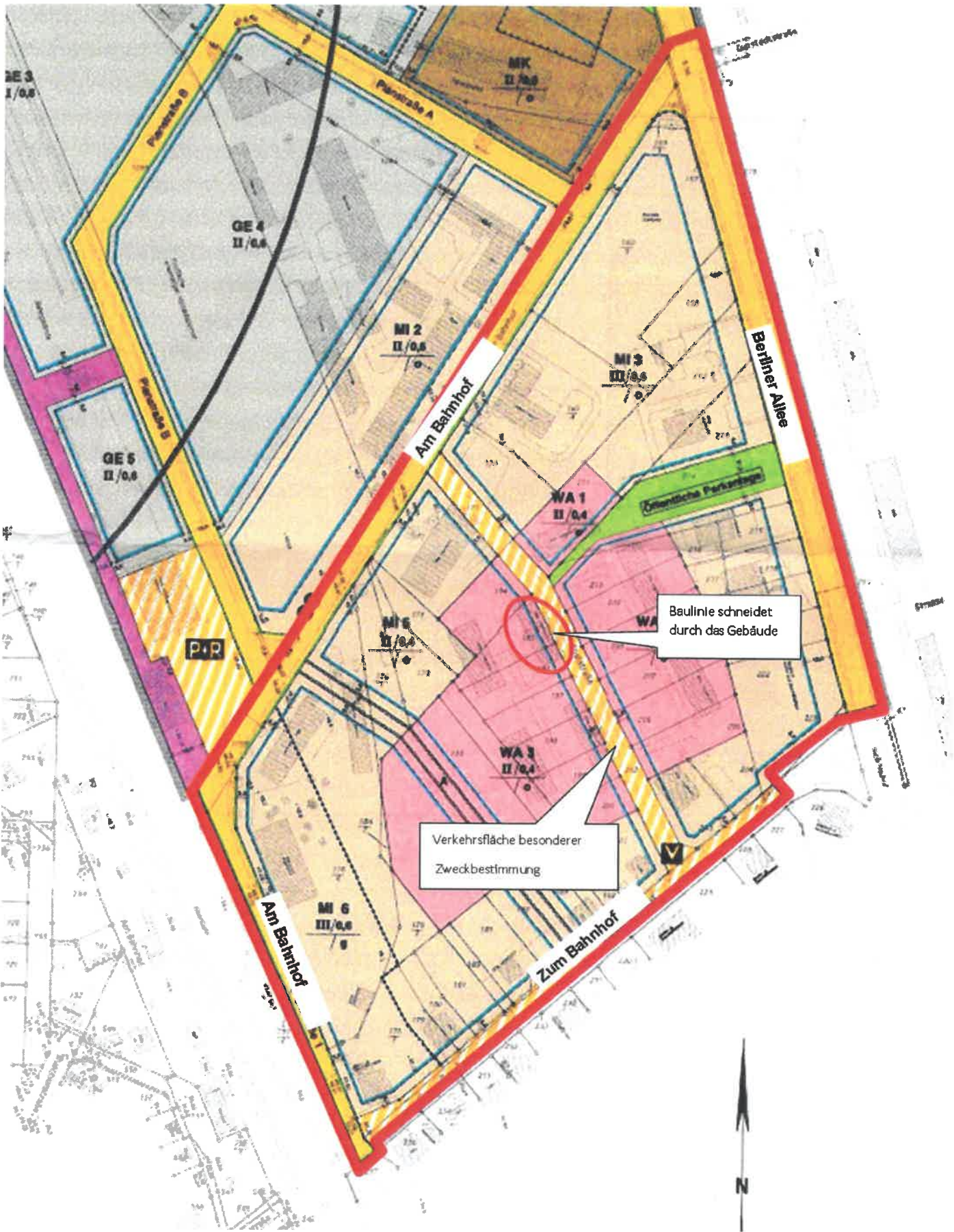
Geltungsbereich der 3. Änderung