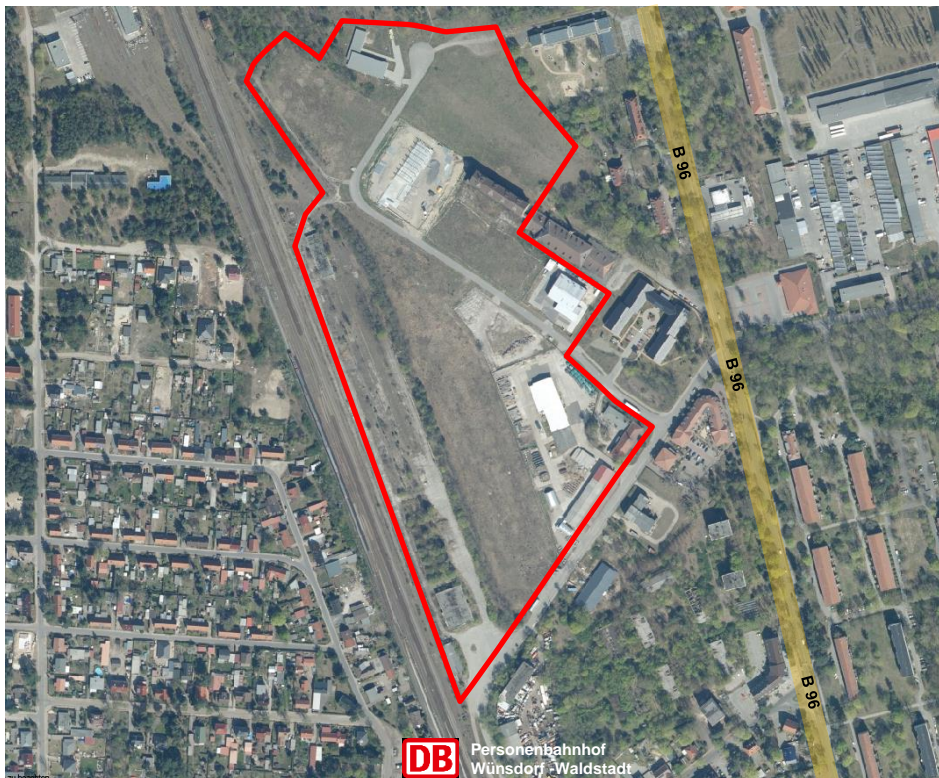
Luftbild mit Kennzeichnung des Gewerbegebietes